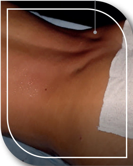
Hoyuelos de Venus